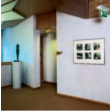
Michel van Overbeeke, 'Table I II III & Meeting I II III' 1994, lithografie en aquatint opgehoogd met goud, opl. 10/100, (6x) 20 x 20 cm. inv.nr. GU 0734