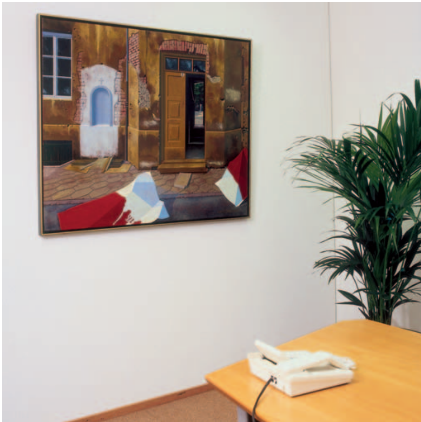
olieverf op doek, 140 x 110 cm. inv.nr. GU 1519