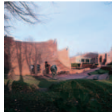
Museum voor figuratieve kunst De Buitenplaats te Eelde.

Misschien is het aan de post-modernistische opvatting van het naast elkaar bestaan van meerdere waarheden in onder andere de kunst te danken, dat in Nederland in de 90-er jaren organische architectuur en figuratieve kunst overal in het 'officiële circuit' weer bespreekbaar worden. De lang veronderstelde