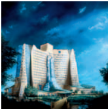
Ger Eikendal, 'Hoofdkantoor.' 1991, olieverf op paneel, 121 x 121 cm. inv.nr. GU 0600

omgekeerde: vormsnoei levert hier 'groene architectuur' op. 'Gebouwde natuur' en 'groene architectuur' vormen zo elkaars pendant. Waar de ontwerpwijze voor gelijkenissen zorgt, geven locatie, schaal en functie onderscheid. Het gasgebouw oogt met zijn energieke centrale ontmoetingsruimte en de opening naar de buitenwereld vooral communicatief. Het besloten museumpaviljoen nodigt met de lichtinval van bovenaf vooral uit tot contemplatie.